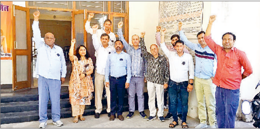
झज्जर। मार्केट कमेटी परिसर में नारेबाजी कर विरोध जताते हुए कर्मचारी।