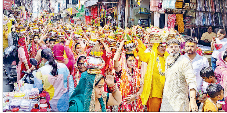
बहादुरगढ़। मंगलवार को कलश सिर पर रखकर यात्रा निकालती महिलाएं।

जटवाड़ा मोहल्ला स्थित तीन शक्ति मंदिर में मंगलवार को भव्य कलश यात्रा निकाली गई, जिसके साथ 7 दिवसीय श्रीमद् भागवत कथा महोत्सव का शुभारंभ हुआ। कलश यात्रा में बड़ी संख्या में महिलाओं ने सिर पर कलश धारण कर भाग लिया, वहीं श्रद्धालु भजन-कीर्तन करते हुए पूरे उत्साह के साथ शामिल हुए। यह कलश यात्रा मंदिर परिसर से शुरू होकर शहर के मेन बाजार व