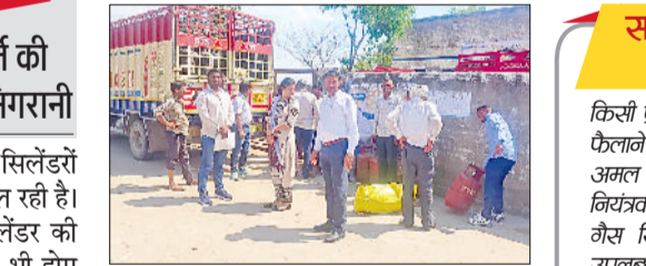
झज्जर। गैस एजेंसी गोदाम का निरीक्षण करने के दौरान उपस्थित विभागीय टीम।

प्रकार की कोई कमी नहीं है। एलपीजी गैस सिलेंडर की जमाखोरी और कालाबाजारी पर रोक को लेकर शासन-प्रशासन सजग व सतर्क है, अधिकारियों द्वारा नियमित निगरानी की जा रही है।