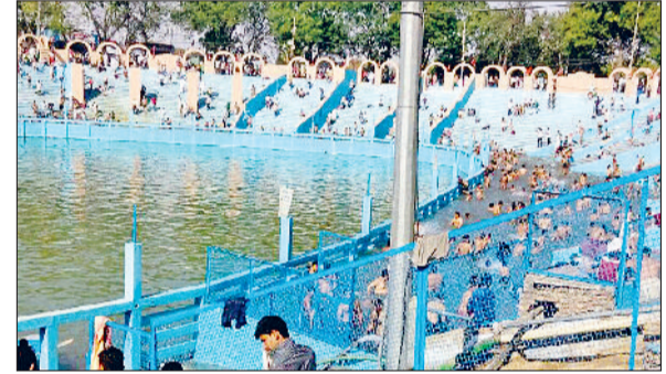
हरिभूमि न्यूज बहादुरगढ़

शहर से सटे झाड़ोदा कलां गांव में बाबा हरिदास मठ में छमाही मेले के दौरान मंगलवार को छठ पर्व के अवसर पर श्रद्धालुओं का तांता लगा रहा। यहां हजारों भक्तों ने पवित्र सरोवर में स्नान कर शीश नवाया और मन्नतें मांगीं। पुलिस प्रशासन ने सुरक्षा के कड़े इंतजाम कर रखे थे। बता दें कि गांव झाड़ोदा में बाबा हरिदास का मेला साल में दो बार चैत्र व अश्विन शुक्ल की छठ को लगता है। यहां प्रदेश भर के अलावा देश के कई हिस्सों से लोग शिरकत करते हैं। मंगलवार को हजारों लोगों ने यहां पहुंच कर बाबा का आशीर्वाद लिया। दिल्ली, राजस्थान व उत्तर प्रदेश समेत दूर-दूर से