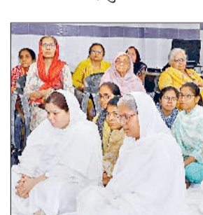
बहादुरगढ़। श्री शांति प्रेम मंदिर द्वारा आयोजित कथा सुनती श्रद्धालु।