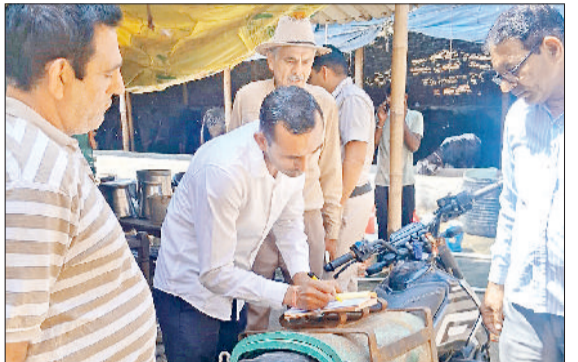
बहादुरगढ़। मंगलवार को कार्रवाई के दौरान चालान काटते नप अधिकारी।

नगर परिषद की इस कार्रवाई के दौरान कुछ डेयरी मालिकों ने चालान लेने से साफ इनकार कर दिया। इसके बाद नगर परिषद की टीम ने चालान उनके घरों के बाहर चरपा कर दिए और चेतावनी दी कि यदि आज ही चालान की राशि जमा नहीं करवाई गई तो उनके खिलाफ बड़ी कार्रवाई की जाएगी। दरअसल, पटेल नगर इलाके में अवैध डेयरियों के कारण काफी समय से गंदगी फैली हुई है। नालियों में गोबर बहने की वजह से गंदे पानी की निकासी नहीं हो पा रही और गलियों में गंदा पानी जमा हो रहा है। इससे स्थानीय लोगों को भारी परेशानी का सामना करना पड़ रहा है और क्षेत्र में बीमारियां फैलने का खतरा भी बढ़ गया है। स्थानीय लोगों का कहना है कि