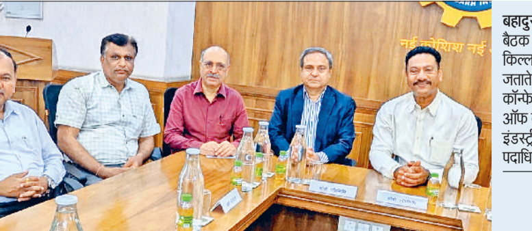
बहादुरगढ़। बैठक में गैस किल्लत पर चिंता जताते कॉन्फेडरेशन ऑफ बहादुरगढ़ इंडस्ट्रीज के पदाधिकारी।

नवरात्र पर्व पर माता भीमेश्वरी देवी मंदिर में आयोजित भव्य मेले के दौरान तीन दिवसीय विश्व शांति महायज्ञ का आयोजन किया जा रहा है। विशेष आकर्षण के रूप में 11 हजार दीप प्रज्वलित कर पूरे परिसर को आध्यात्मिक ऊर्जा से आलोकित किया जाएगा। महायज्ञ का व्यवस्थाओं और सुरक्षा इंतजामों का जायजा लेने के लिए पुलिस कमिश्नर डॉ. राजश्री सिंह ने निरीक्षण किया और संबंधित अधिकारियों को आवश्यक दिशा-निर्देश दिए। उन्होंने सबसे पहले पुराने मंदिर परिसर के समीप बने