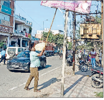
झंझार। खंभों पर लगे होर्डिंग को उतारते हुए नगर परिषद के कर्मचारी।