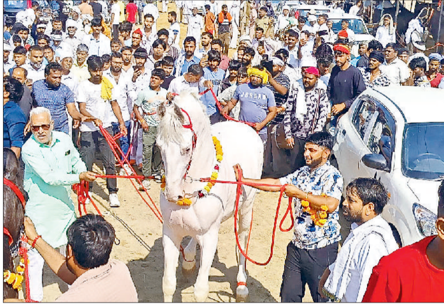
झज्जर। बाज नामक घोड़े की सुंदरता को देखने के लिए मेले में लगी लोगों की भीड़।

हरियाणा के अलावा पंजाब, उत्तरप्रदेश और महाराष्ट्र जैसे राज्यों में भी अपनी सुंदरता का प्रदर्शन कर चुका है बाज