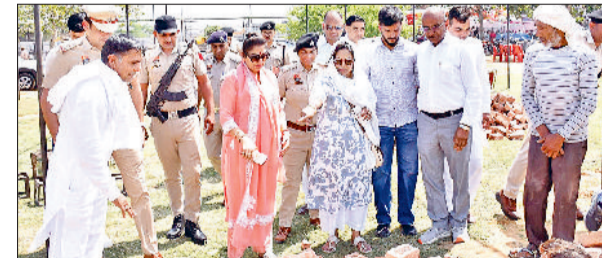
बेरी। माता भीमेश्वरी देवी मंदिर परिसर में जायजा लेते हुए पुलिस कमिश्नर।