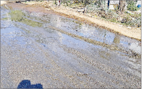
बहादुरगढ़। पटेल नगर व सेक्टर डेवाइडिंग सड़क पर बह रहा गोबर।