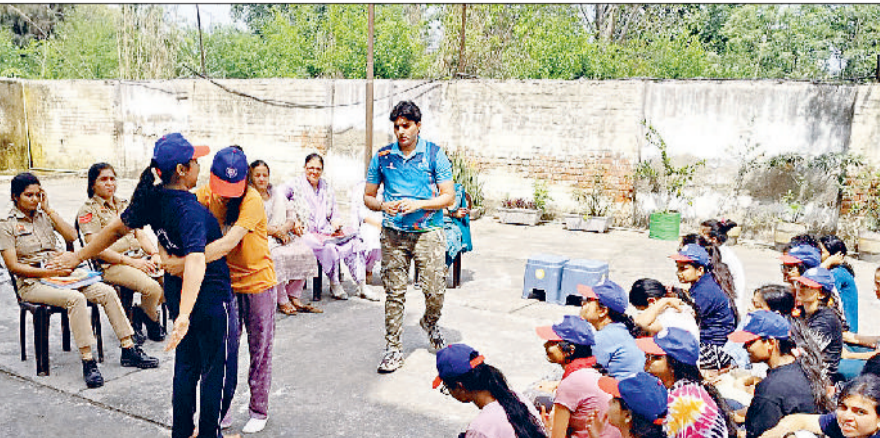
झज्जर। स्वयंसेविकाओं को आत्मरक्षा के गुर सिखाते हुए महिला पुलिसकर्मी।